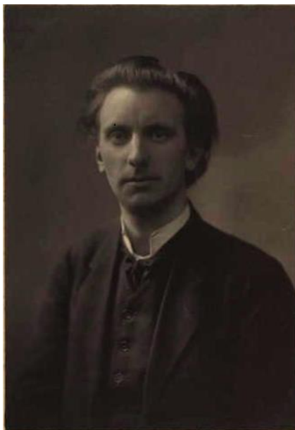
Rued Langgaard 1918