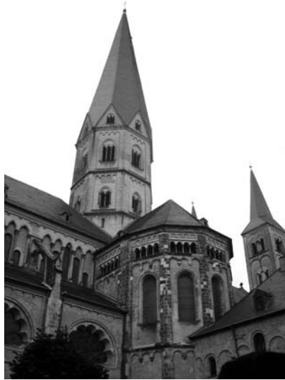
St. Martin i Bonn