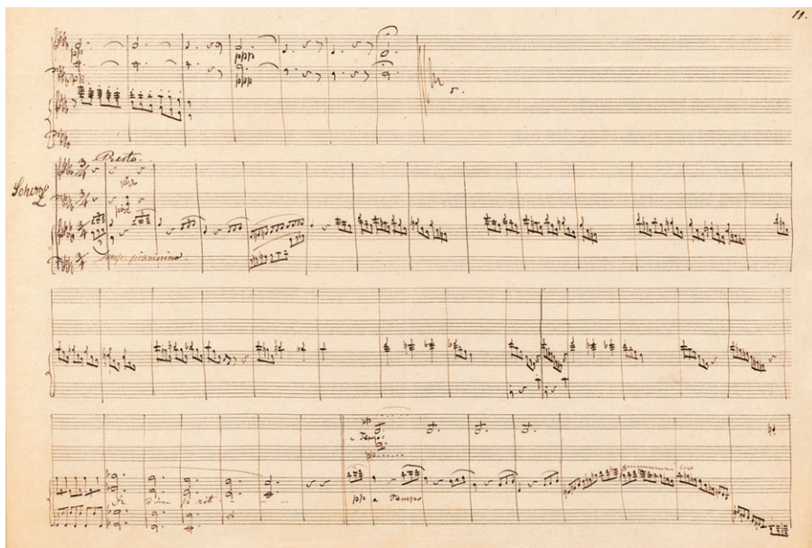
N.W. Gades skitse til den ufuldendte Klavertrio i B-dur.