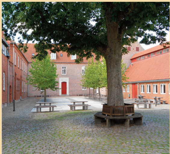
Ribe Katedralskole.