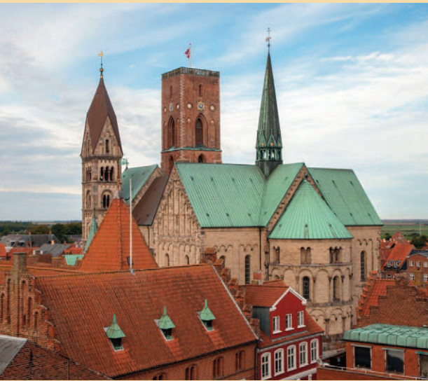
Ribe Domkirke.