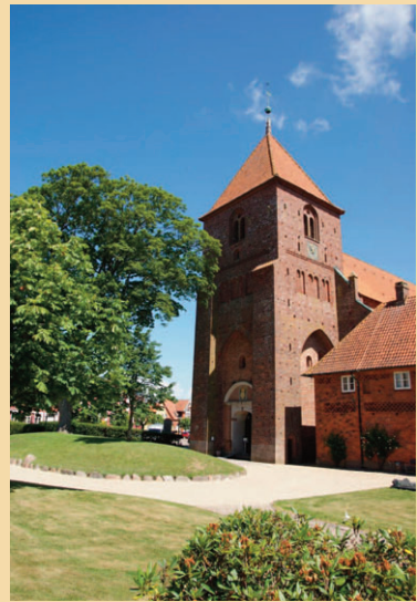
Sct. Catharinæ Kirke.