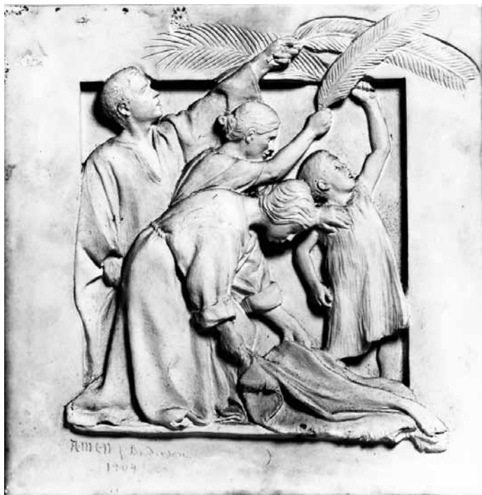
Carl Nielsen m.fl. på Kathoveddøren til Ribe Domkirke. Anne Marie Carl-Nielsen 1904 (gipsafstøbning).

Rued Langgaards had til Carl Nielsen kulminerer i sommeren 1948 med det rablende, tragikomiske korværk Carl Nielsen, vor store Komponist , der skal »Repereteres i al Evighed«, og hvor Langgaard i forordet opregner sine plager: »Betale i 40 aar for at blive skældt ud i Carl Nielsen Pressen... Betale for Carl Nielsen i Radio ... Betale for om Sommeren at sidde i Urnehallen!«