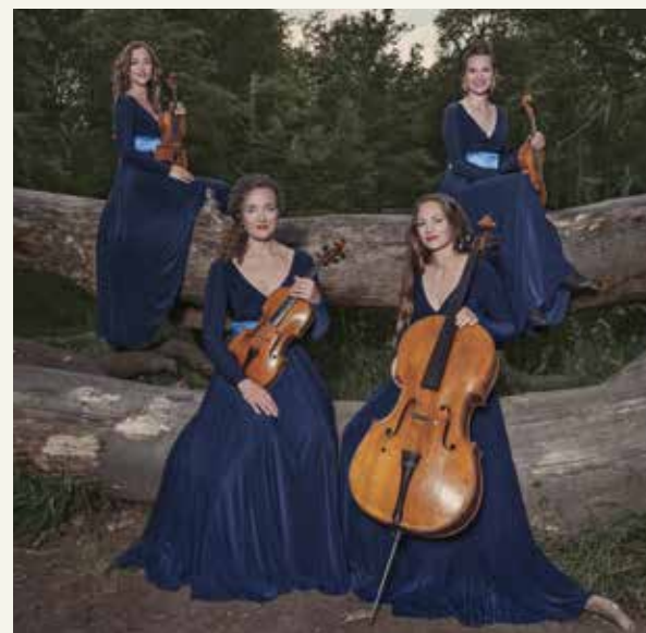
Nightingale String Quartet.