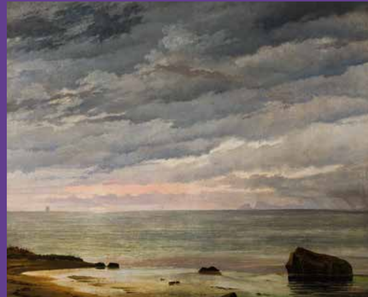
"Den opgående sol over havet" (1838). Olie på lærred, 79 x 94 cm