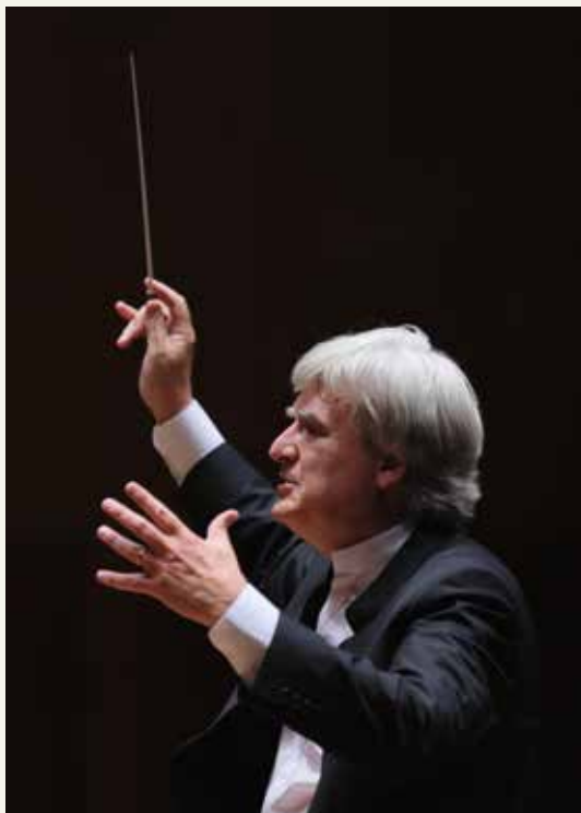
Thomas Dausgaard, dirigent.

gent 1997–2019) og Orchestra della Toscana. Han var også musikdirektør for Seattle Symphony (2019–2022) og æresdirigent for DR SymfoniOrkestret, hvor han var chefdirigent fra 2004 til 2011 som den første dansker nogensinde. Dausgaard har samarbejdet med mange af verdens førende orkestre og optrådt ved prestigefyldte festivaler, samt turneret i Europa og USA og Japan. Dausgaards udforsker også den symfoniske musik i sine programmer ved at kombinere den med andre stilarter fx Carl Nielsen med folkemusikere,